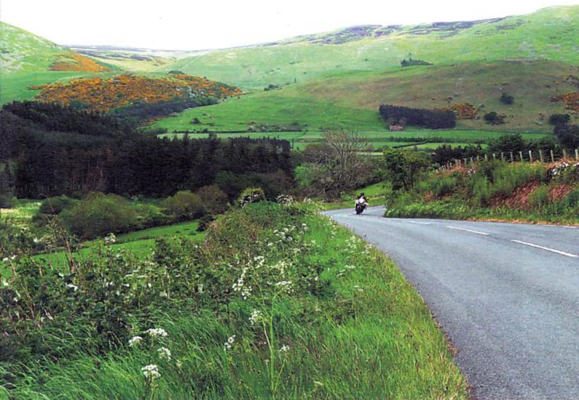
Echt schottisch: Grüne Hügel und wenig befahrene Straßen bis zum Horizont.