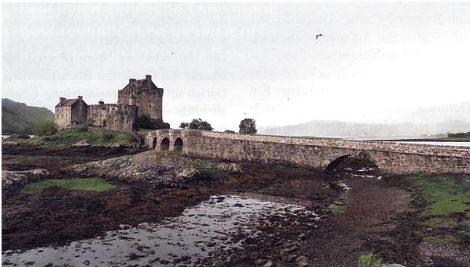
Hollywood-Star: Eilean Donan Castle diente dem Highlander als Filmkulisse.