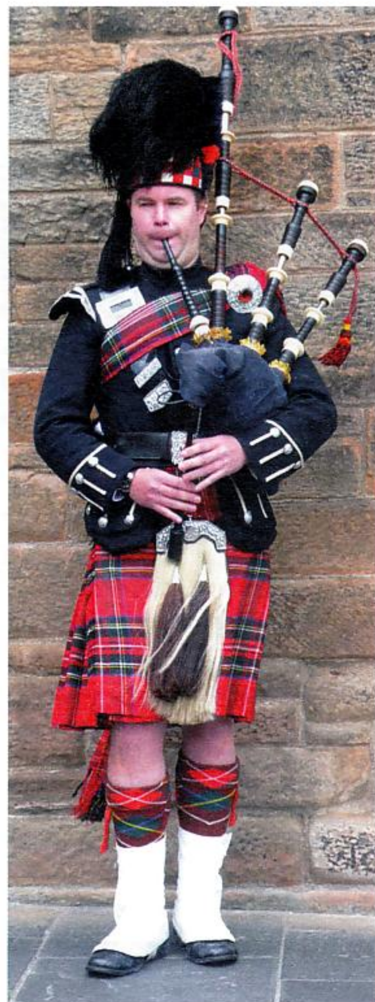
Pflicht-Foto: Der Standard-Schotte für das Familien-Album gehört dazu.

Best Western-Hotel: Atmosphäre wie in einem alten Edgar- Wallace-Streifen.